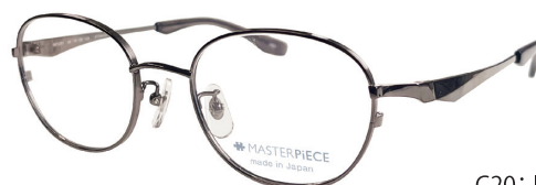
C20: IPGY IPグレー