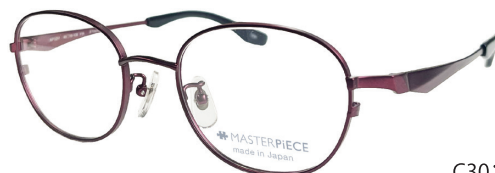
C30: BD ボルドー