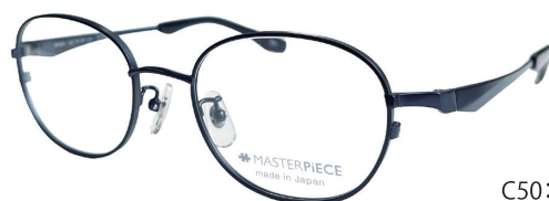
C50: NV ネイビー