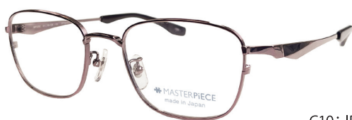
C10: IPBR IPブラウン