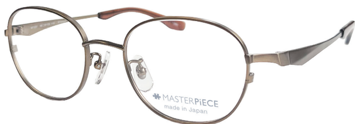
C40: AG アンティークゴールド