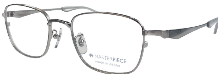
C70: TI チタンソリッド