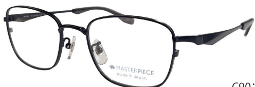
C90: BK ブラックマット