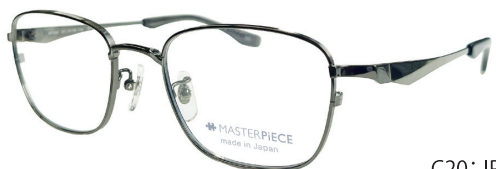
C20: IPGY IPグレー