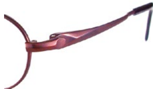
C30 (DB/DBD) ボルドー / ダークボルドー