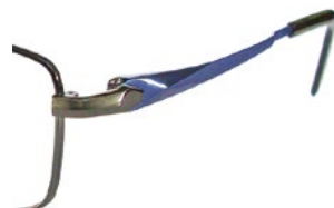
C65 (GN/BL) グリーン / ミステリアスブルー