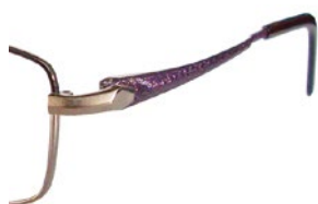
C11 (BR/KBR) ブラウン / レザーブラウン