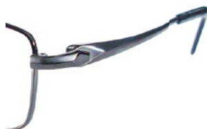
C20 (IPGY) IPグレー