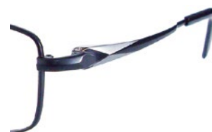
C97 (BK/W) ブラック / W