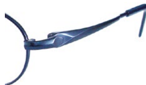
C50 (DBL) ミステリアスブルー