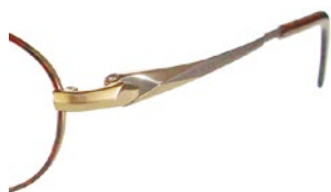
C11 (BR/DM) ブラウン / ブラウンデミ