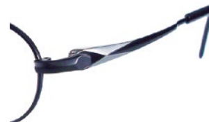
C97 (BK/W) ブラック / W